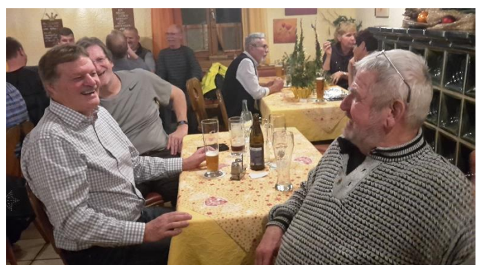
„gute Unterhaltung nach dem Essen