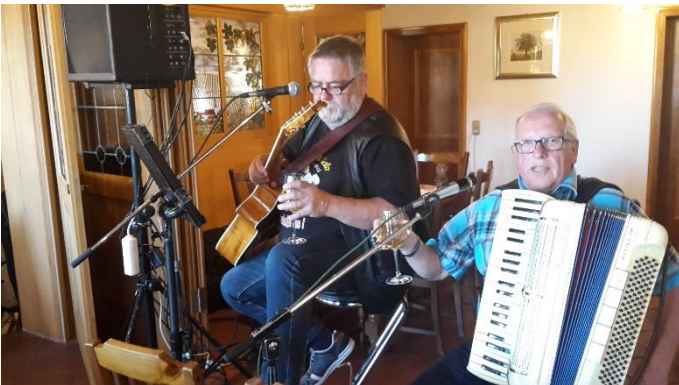
etz trink mer amol, dann spiel mer auf