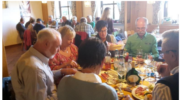
die Brotzeit schmeckte allen