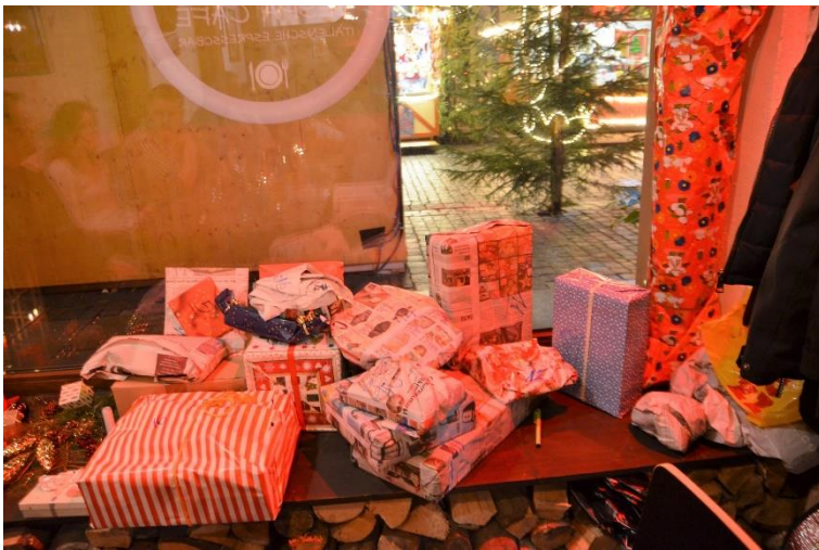
Schrottwichtelgeschenke für jedermann