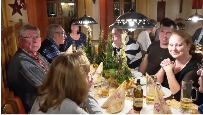
in Erwartung der Gans

Das traditionelle Gans- und Kalbshaxenessen zum Jahresabschluss im Landgasthof Hubert in Rettern am 07.12.2018 war, wie immer, die meistbesuchte Veranstaltung des Jahres. Etwa 90 Personen unserer AH besetzten Gaststube und Nebenzimmer. Bei bester Bewirtung konnte man sich auf das bevorstehende Weihnachtsfest einstellen.