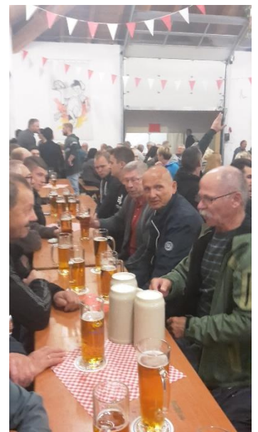
„ein Krug hätte mir auch gereicht“