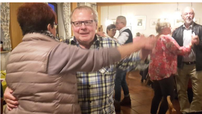
der Vorstand tanzt voran