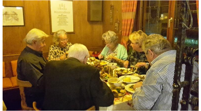
das Essen schmeckt