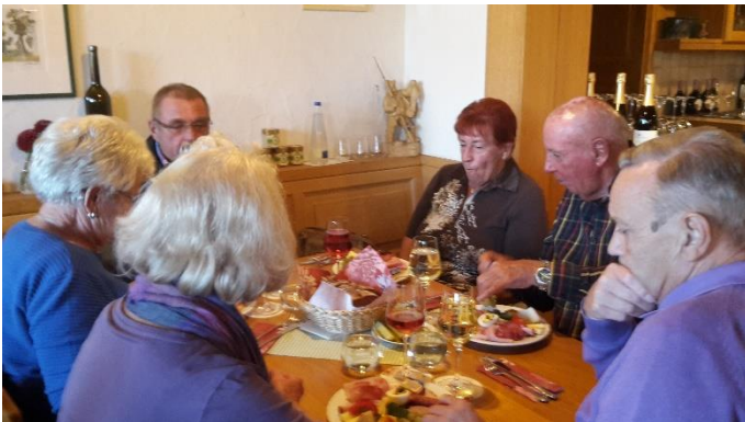
zu zweit kann man den vielleicht Teller schaffen