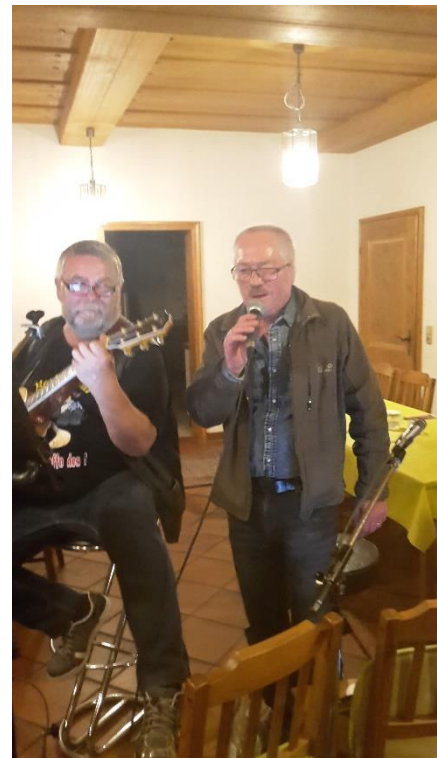
„Elvis“ im Einsatz