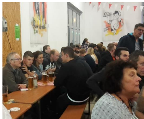
trotz Musik war Unterhaltung möglich