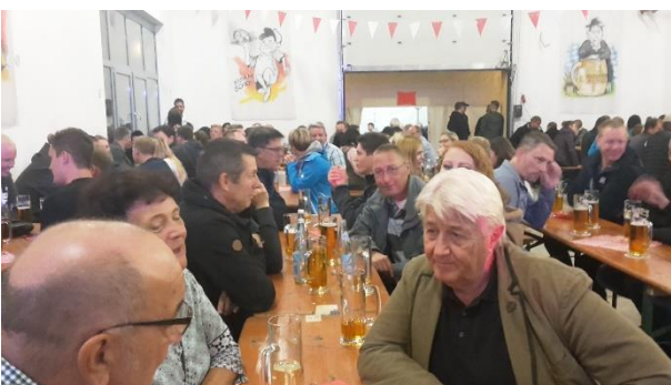
die „Trinkhalle“ war gut gefüllt

Auch heuer wieder fuhr die AH am 19. Oktober zum Bockbieranstich nach Tiefenellern zur Brauerei Hönig. Bei süffigem Festbier, guten Essen und Unterhaltungsmusik verbrachte man, wie schon in den Vorjahren, einen „feuchtfröhlichen“ Abend. Gegen 23.00 Uhr wurde bei bester Laune die Heimfahrt angetreten.