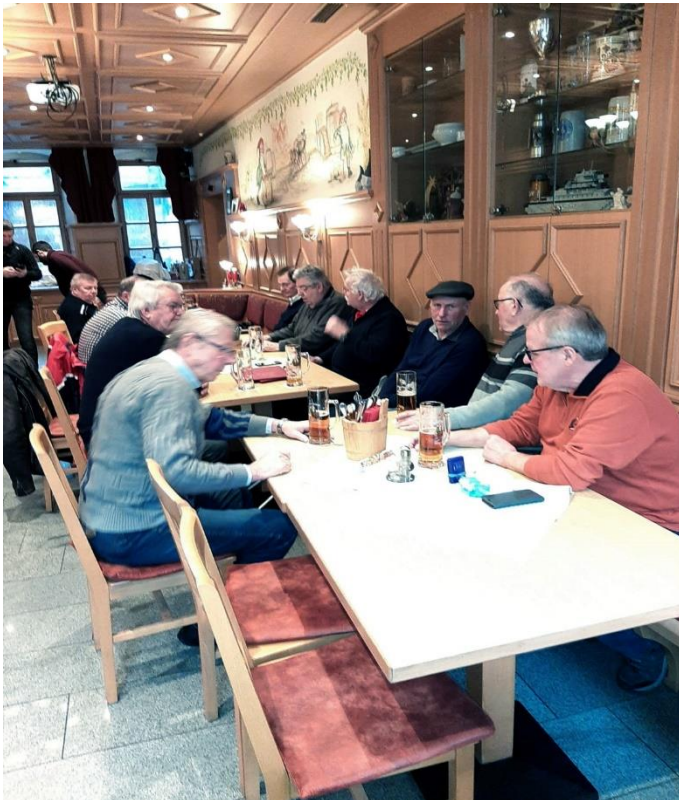
beschauliche Unterhaltung im „Fässla“

Am 25. 01. 2020 traf sich etwa 12 AH - Mitglieder vormittags am Forchheimer Bahnhof zur Fahrt nach Bamberg ins „Fässla“. Nach Frühschoppen und Mittagessen fuhr man am Spätnachmittag wieder nach Forchheim zurück.