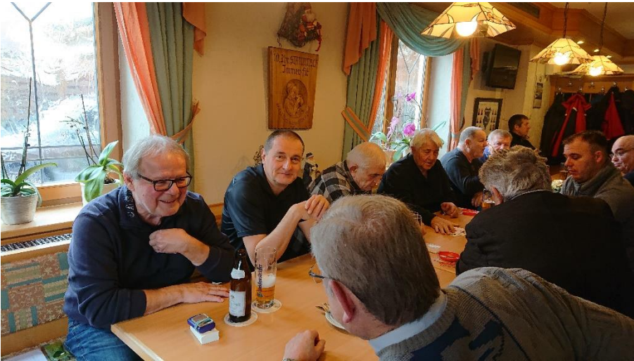
man wartet aufs Essen

Wegen schlechter Wetterverhältnisse machten sich nur wenige auf den Weg nach Heroldsbach zum „Humba“. Zum Mittagessen fanden aber etwa 30 AH-Mitglieder den Weg nach Heroldsbach.