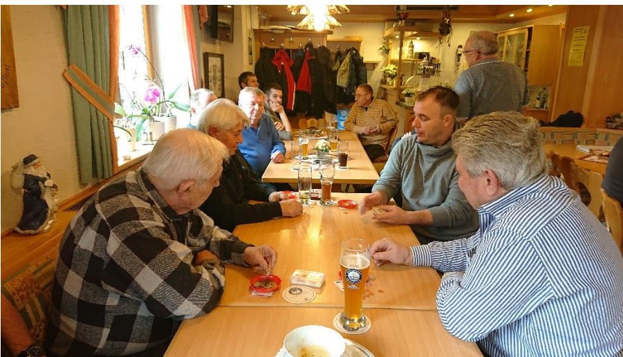
ein kurzer Schafkopf als „Nachtisch“