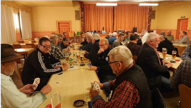
volle Konzentration beim Kampf um die Punkte