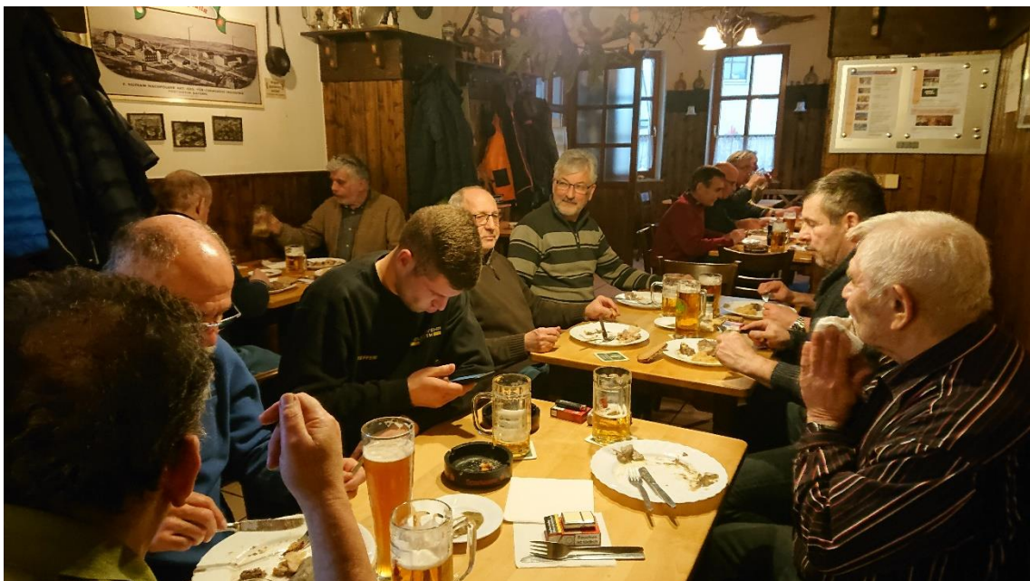
bei einigen ist es ist „vollbracht“