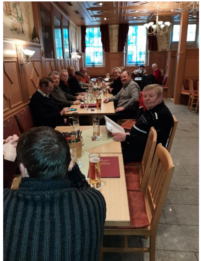
entspanntes Warten auf das nächste Bier