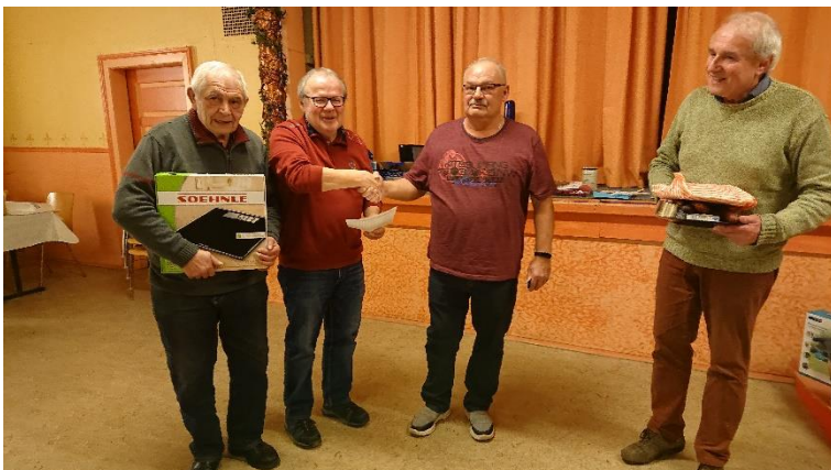
Kunner ehrt die drei Erstplatzierten