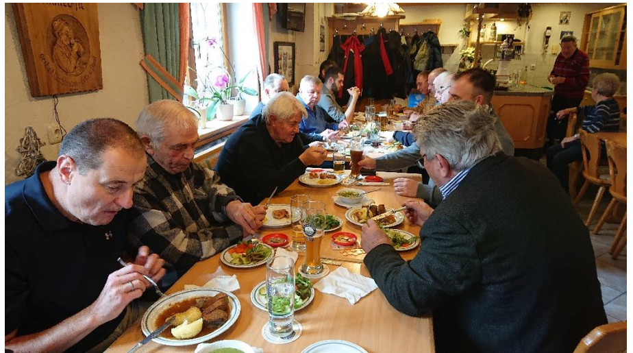
wie immer, ein hervorragendes Essen