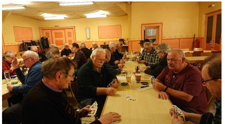
man schenkt sich nichts