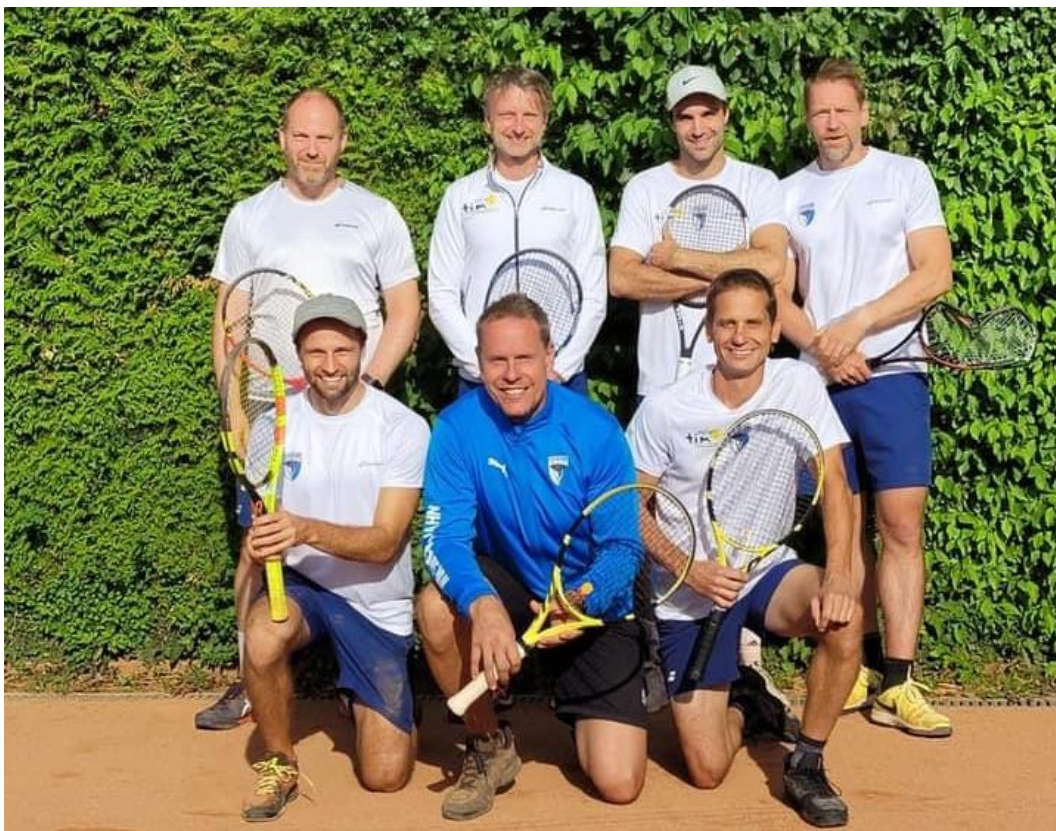
Die Herren 30 der Landesliga

Die durchwachsene Saison der Herren 30 in der Landesliga konnte mit einem 5:4-Sieg gegen den SSKC Pos. Aschaffenburg beendet werden. Einen weiteren Sieg feierten die Herren des Jahn Forchheim im zweiten Spiel gegen den SC Uttenreuth (6:3), in dem die Doppelstärke bewiesen wurde und alle drei Doppel gewonnen werden konnten. Am Ende der Saison reichte es mit nur zwei Siegen aus sieben Spielen nur für den 7. Platz.