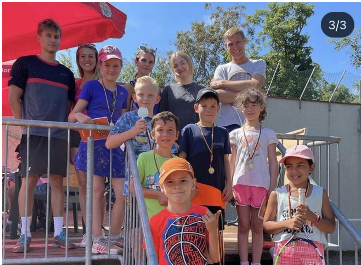
Am diesjährigen KidsTreff Abschlussturnier