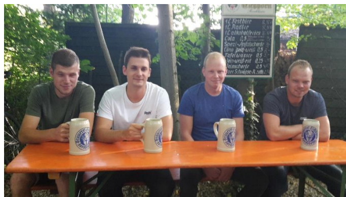
Auch den Jungen gefiel es