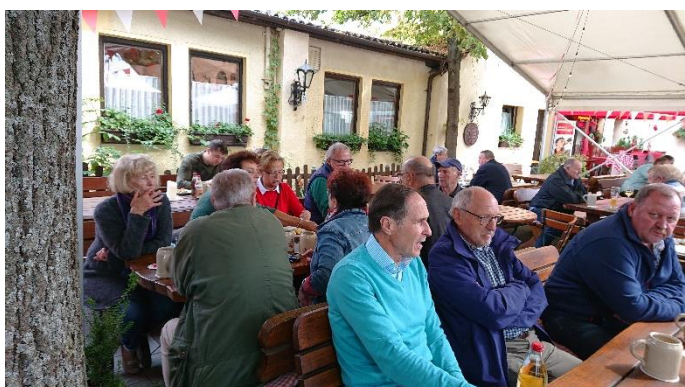
bei Essen und Trinken war man gut aufgehoben