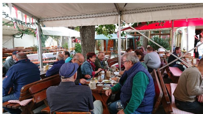
bei Essen und Trinken war man gut aufgehoben