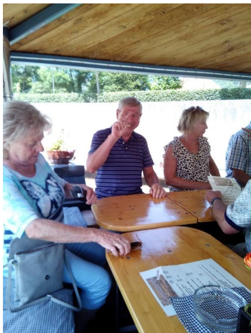
Hier gibt's auch „Kurze“