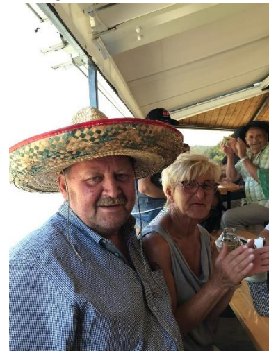
Der Hut war nicht zu übersehen