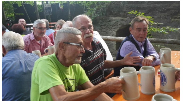
Das Bier war sehr süffig