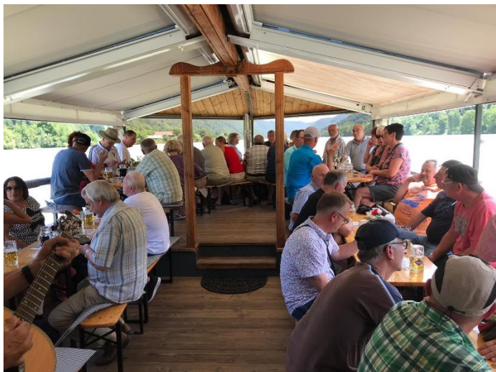
Die Arche war voll besetzt