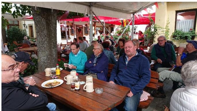
Im Garten der Brauerei Kraus

Bei gutem Wetter starteten zwei unverzagte Radfahrer zum Brauereigasthof Kraus in Hirschaid, wo die Kirchweih angesagt war. Um die Mittagszeit wuchs jedoch die Teilnehmerzahl auf etwa 25 Mitglieder an, die mit dem Auto nachgekommen waren.