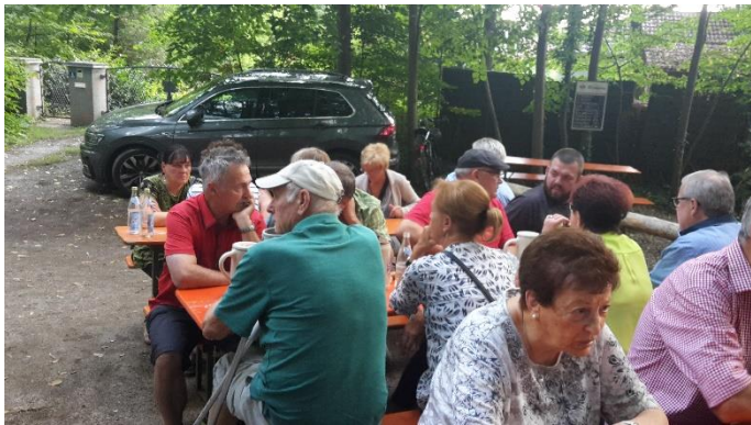
Das Wetter sorgte für gute Laune

Auf dem Blümleinskeller fanden sich am Samstag, 27.07. und am Donnerstag, 01.08. zahlreiche Mitglieder der AH zu einer gemütlichen Zusammenkunft ein. Bei bestem Wetter, etwas abseits vom großen Trubel, konnte man sich hier ungestört einer guten Eichhornmaß widmen.