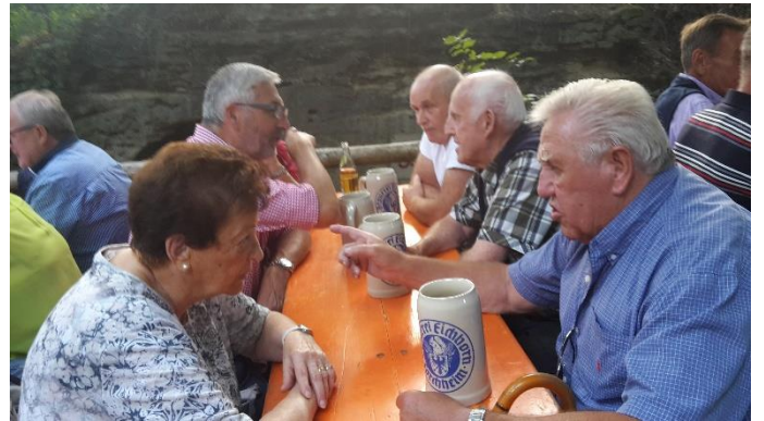
„eine Maß trink ich noch“